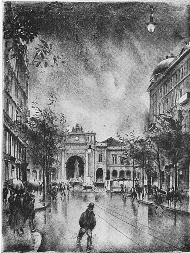
Blick von der Bahnhofstrasse zum Bahnhof Nach einer Lithographie von O. Baumberger

Gewiss, wir leben rascher in Zürich als anderswo. Der Strom der Welt reisst uns mit. Und wir lassen uns reissen. Unklug wär's, wir stemmten uns mit Gewalt gegen den Ansturm der Zeit. Denn wir haben nun einmal an die grosse Völkerstrasse gebaut, und jetzt flutet das Leben in Expresszügen von Norden und Süden daher, von Osten und Westen, und gerne verweilt's für kürzer und länger unter uns und geniesst das Treiben der heranwachsenden Großstadt.