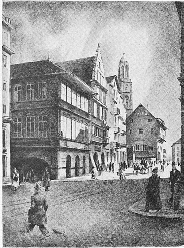
Rathausquai mit Saffran und Räden Nach einer Lithographie von O. Baumberger

La gazzetta germanica di viaggi «Verkehr und Bäder» pubblicò in uno dei suoi ultimi numeri il risultato di un concorso a premi per i nomi più espressivi e caratteristici degli otto treni direttissimi diramantisi da Berlino in tutte le direzioni. Seguendo l'esempio dell'America, dell'Inghilterra e della Francia, ove alcuni treni diretti specialmente importanti portano una designazione divenuta da lungo popolare, come il «XX th Century», il «Flying Scotchman» ed il «Golden Arrow», i più rapidi treni diretti della Ferrovia germanica del Reich porteranno in avvenire i nomi usciti vincitori dal concorso: questi nomi figureranno in tutti gli orari. A noi interessa in particolare l'«Helvetia-Express» (quale corrispondenza F. D. 163/164 fra l'Olanda e Basilea) che, in provenienza da Berlino, in poco più di 13 ore arriva a Basilea alle 20.54. In direzione opposta, l'«Helvetia-Express» parte da Basilea alle ore 9 e giunge a Berlino alle 22.09.