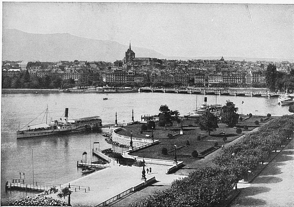
Genève / Genève