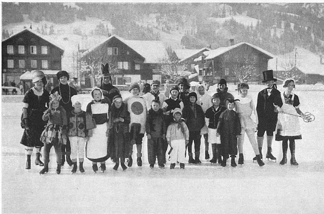
Eiskarneval / Carnaval à patin