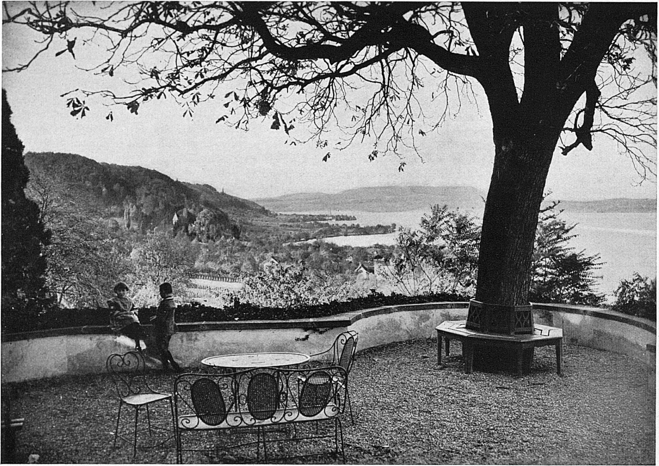
Auf Schloss Arenenberg am Bodensee / Au château d'Arenenberg sur le lac de Constance

dern, links unter ihm die Schale des Bodensees, rechts das Rheintal mit seinen in der Flut der Blüten fast ertrunkenen Dörfern — oder sich nach Heiden und tiefer ins Appenzellerland locken lassen? Auch die, welche von Zürich, Weinfelden nach Romanshorn fahren, haben manche Möglichkeiten landeinwärts oder dem See entlang, etwa nach dem geschichtlich und landschaftlich so reizvollen Arbon. Oder sie fahren gleich weiter nach Konstanz, das nun seit einiger Zeit auch für den Schweizer wieder als Ausflugsort in Betracht kommt. Denn für 50 Rappen wird ihm am Schweizerbahnhof eine Tageskarte in die Hand gedrückt, und nun steht ihm das deutsche Land offen — zunächst die schöne deutsche Stadt mit ihrem Münster, der winkligen Altstadt, dem Stadtgarten am plätschernden Seeufer. Vielleicht unternimmt er im Laufe des Tages einen Ausflug nach der nahen Insel Mainau oder eine andere Seefahrt.