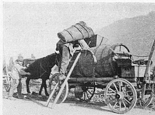
Rentrée de la vendange

Le soir, au pressoir, on danse aux sons d'un accordéon ou d'un violon tenu par un artiste du cru. Le dimanche, dans les auberges, une fanfare fait tourner les couples et joue sur les places publiques. Le moût fauve bouillonne dans les verres; les marrons chantent dans la rôtissoire — c'est ce qu'on appelle en terre romande les « châtaignes brizolées ». Des mascarades s'or-