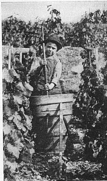
Früh übt sich...