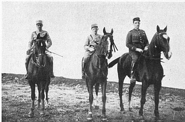
Die Franzosen / Equipe française

Freitag, 9. Nov.: Championnat des Amazones (in- ternat. Prüfung für Damen). Versuch, den Rekord des Hoch- sprunges zu brechen. (Diese Prüfung würde ausfallen, wenn im Hochspringen des Vortages der Rekord bereits gebrochen werden sollte.) Samstag, 10. Nov.: Prix du Rhône (internat. Prüfung), Coupe des Nations, Prix de l'Arve (Paarspringen). Sonntag, 11. Nov.: Grand Prix de Genève (schwere internationale Konkurrenz), Prix d'Adieu (internationales Jagd- springen).