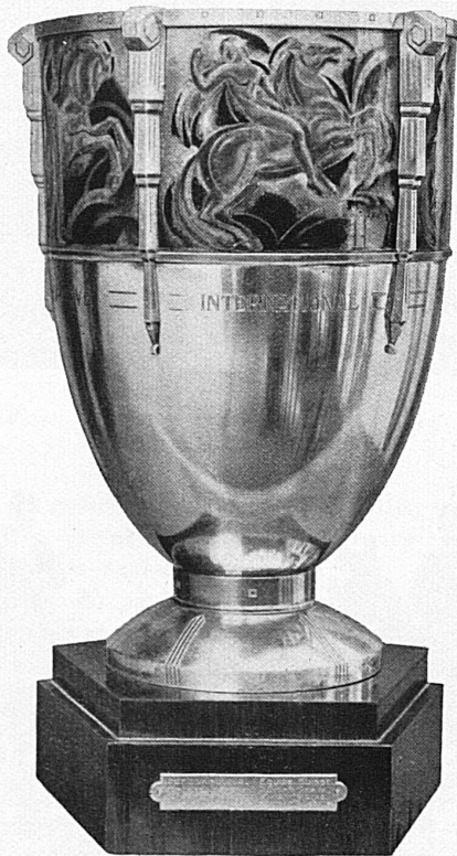
Wanderbecher der Nationen La Coupe des Nations

16 Prüfungen, von denen 12 international, 2 national und 2 von Damen auszutragen sind. Mehrere schwerste Prüfungen werden Reiter wie Pferde vor Höchstleistungen stellen. So führt der «Prix du Mont-Blanc» über 8 Hindernisse von 1 m 20 bis 1 m 80. Der «Prix du Salève» ist ein schweres Jagdspringen, in dem jeder Reiter nacheinander 2 Pferde zu reiten haben wird; ein ebenfalls schweres Jagdspringen über 16 Hindernisse bis 1 m 40 wird der «Prix de St-Georges». Eine interessante, bei uns bisher unbekannt Prüfung wird der «Prix du Rhône», in dem derjenige Reiter Sieger wird, der die meisten Hindernisse gesprungen hat, während jeder Reiter ausscheidet, sobald sein Pferd einen Fehler gemacht hat. Zu den wichtigsten Entscheidungen des diesjährigen Meetings werden der «Grand Prix de Genève» und die «Coupe des Nations». Für die letztere Prüfung bezeichnet jede Nation 3 Reiter mit 3 Pferden. Unsere Reiter werden die kostbare Trophäe, die sie sich letztes Jahr in schwerem Kampf errungen haben, verteidigen müssen. Als weitere, ausserordentlich span-