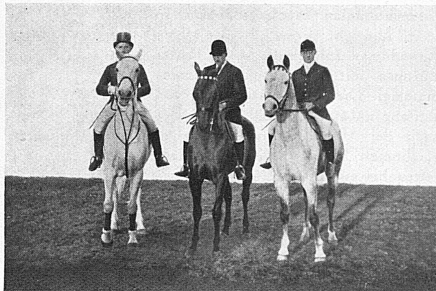
Die Deutschen / Equipe allemande