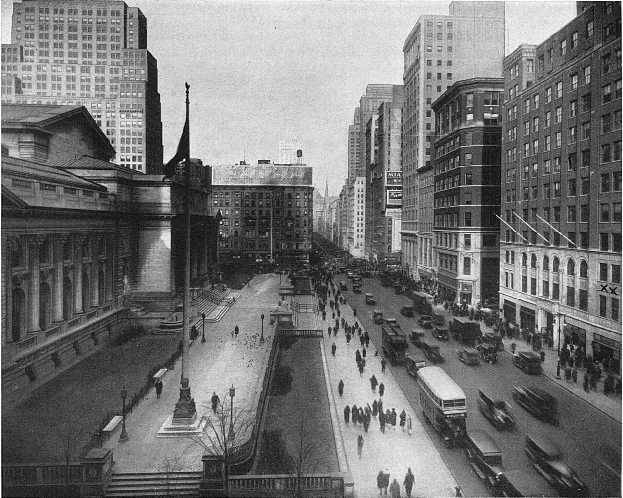
Die Fifth Avenue, New Yorks belebteste Strasse Im Vordergrund rechts ×× die neuen Räume der SBB Agentur

wendige Gegengewicht zur Werbearbeit der übrigen Reiseländer, die übrigens nur eine kurzfristige Einstellung als blosse Konkurrenten betrachten wird. Denn abgesehen davon, dass jede nationale Verkehrspropaganda zur Förderung des Reisens überhaupt beiträgt, verbindet manche Länder gegenüber andern Kontinenten oder Ländergruppen eine ausgesprochene Interessengemeinschaft.