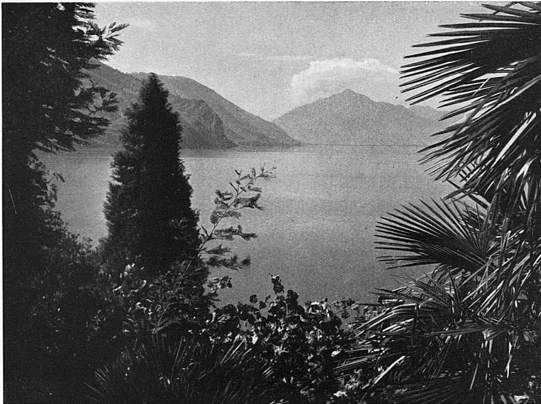
Ravissante échappée sur le lac de Lugano / Entzückender Ausblick auf den Luganersee