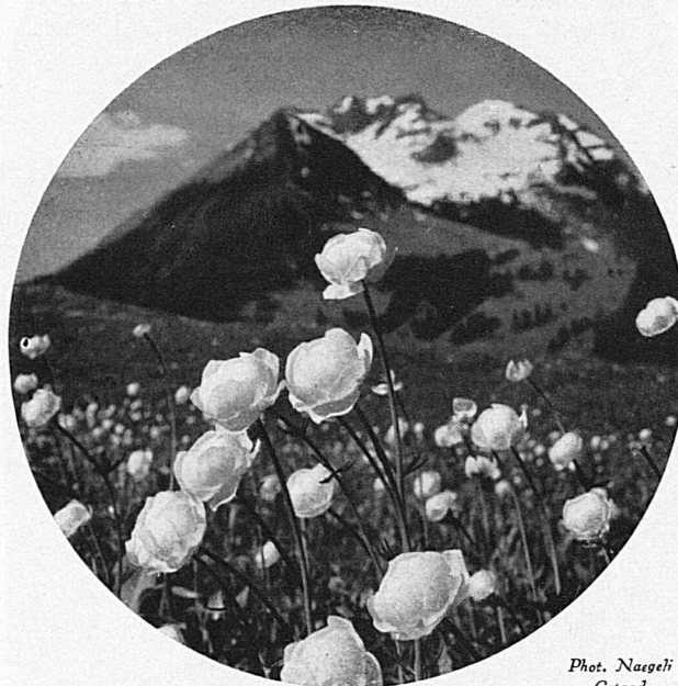
Ankebäli / Renoncules