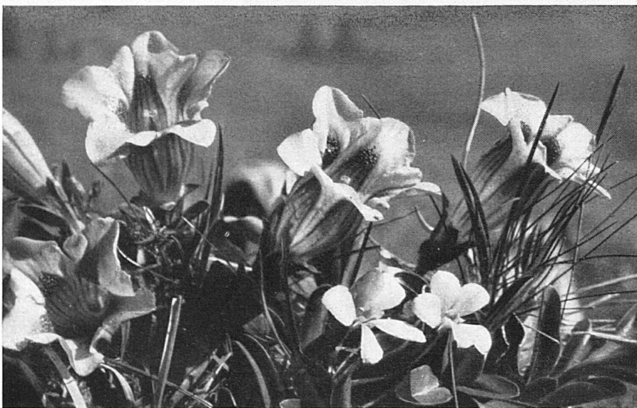
Enzianen / Gentianes