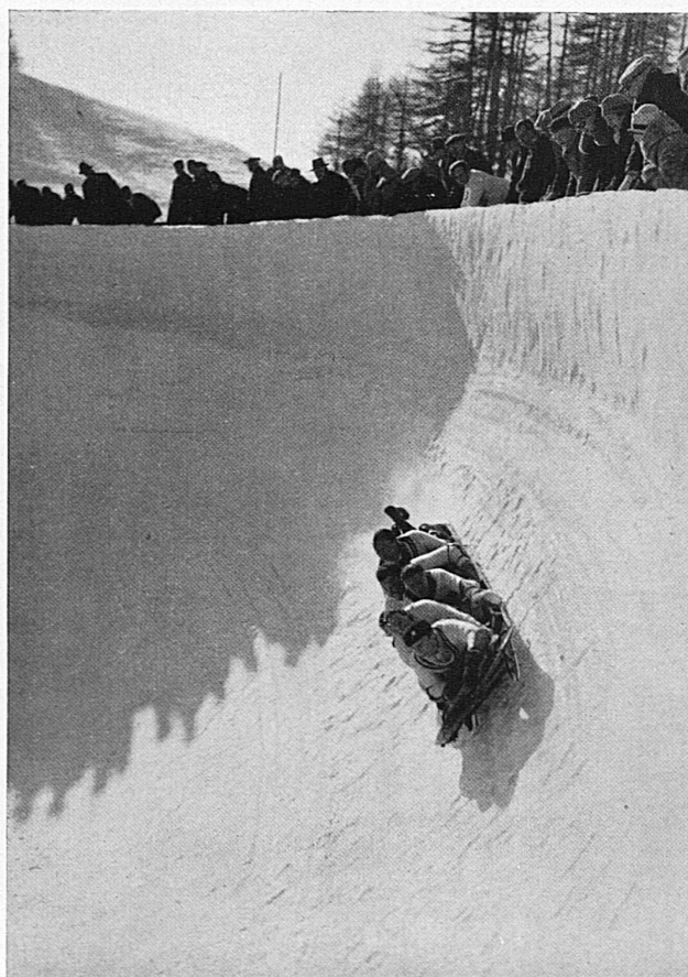
Atembeklemmende Fahrt Course vertigineuse