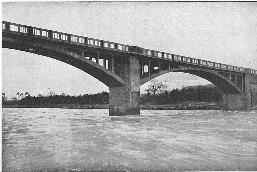
Strassenbrücke über die Thur bei Weinfelden

IN ALLEN BESSEREN TABAK-MAGAZINEN, SPORTARTIKELGESCHÄFTEN, BIJOUTERIEEN, EISENWARENHANDLUNGEN, ZU HABEN