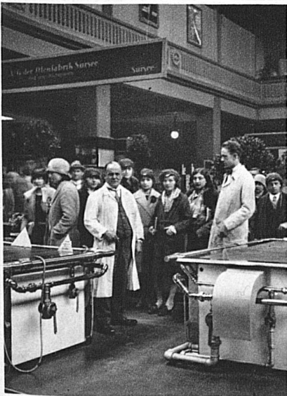
In der Basler Mustermesse