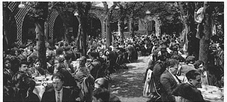
Die Sesa beschafft billige Verpflegung und Unterkunft