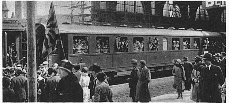
Abfahrt im Bahnhof Zürich nach Basel