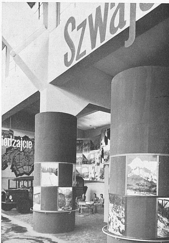
Le pavillon suisse du tourisme à l'Exposition internationale des transports à Posen.