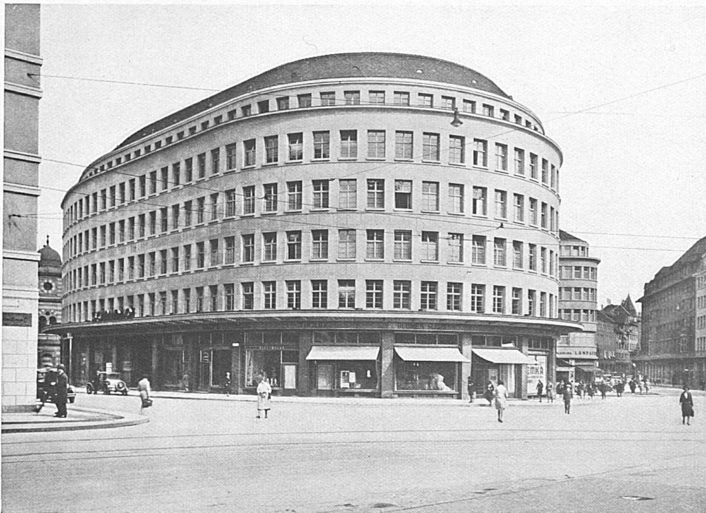
Neubau „Schmidhof“ Zürich