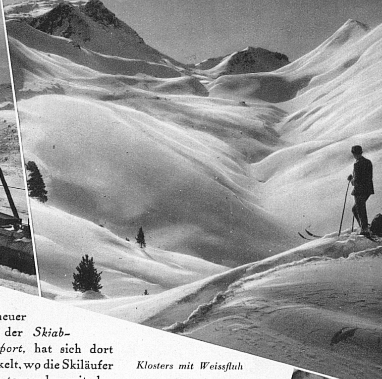
Klosters mit Weissfluh

schanze, die Selfransaschanze in Klosters, die Bolgenschanze in Davos, die Selvaschanze in Flims, die vom Val Sporz auf Lenzerheide? Dort sehen wir begeistert den «fliegenden Menschen» durch die schnittige Winterluft zischen. Pferderennen (auf dem Eis!) in St. Moritz, Mondscheinfahrten der Berninabahn, das Motorrad-Skikjöring in Glarus, die weltberühmten Schlittelrennen Grindelwalds und die Skirennen Wengens sind ebenso einzigartig wie die berühmten klassischen Abfahrtsrennen von Parsenn (Davos und Klosters), von Diavolezza (Pontresina), von Arosa, das Gletscherrennen ob Flims, das Männlichenrennen nach Grindelwald, das Jochpassabfahrtsrennen nach Engelberg.