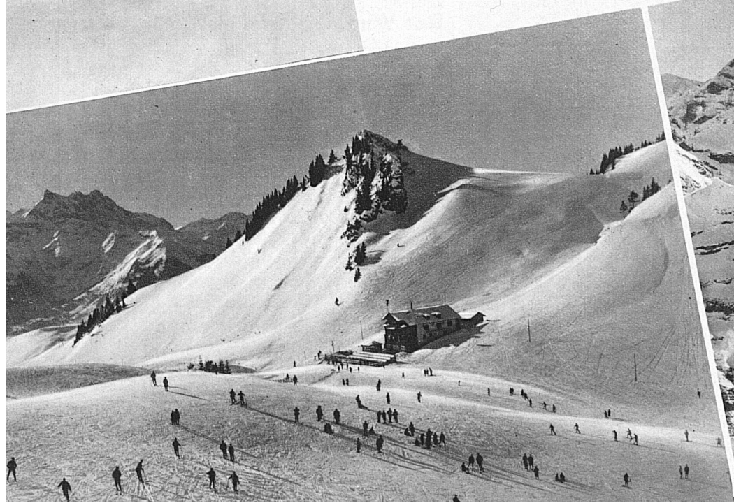
Villars s. Ollon