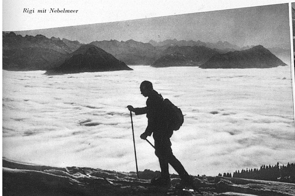
Rigi mit Nebelmeer