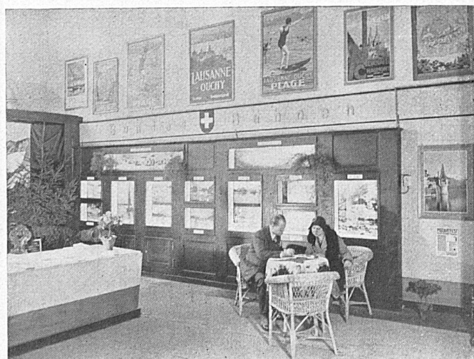
L'agence de Paris des CFF, actuellement en transformation. L'architecte dirigeant les travaux a su tirer de la clôture du chantier le plus judicieux parti.