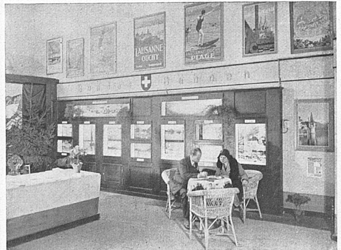
L'agence de Paris des CFF, actuellement en transformation. L'architecte dirigeant les travaux a su tirer de la clôture du chantier le plus judicieux parti.