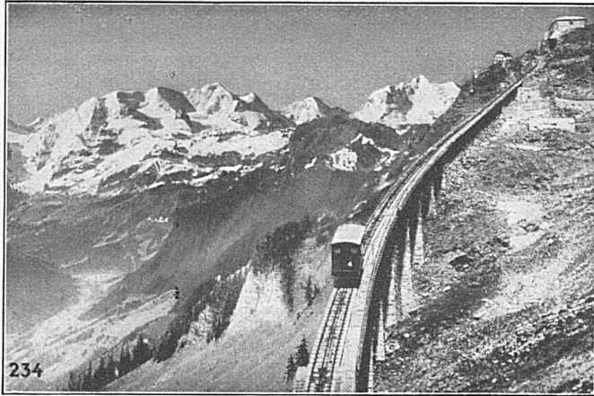
SEILBAHN NIESEN, Berner Oberland. Totale Länge 3496 m, überwundene Höhe 1645 m. Maximalsteigung 68 %.

Walzwerke, Schmiede, Gießereien, Elektrostahlwerk, mech. Werkstätten