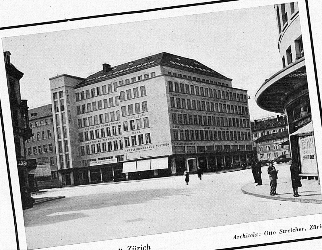
Geschäftshaus „Zentrum“ Zürich