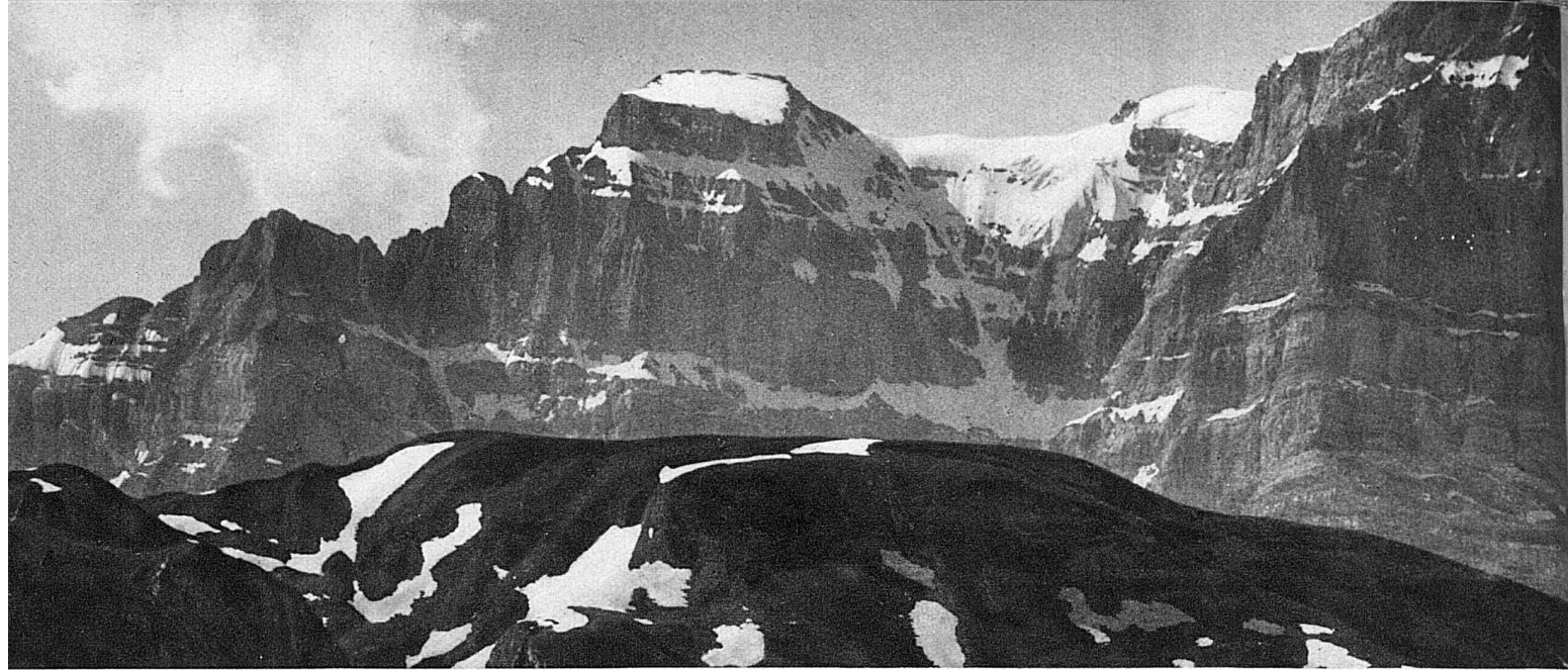
Le sommet saupoudré de neige du „Vrenelisgärtli“ dans le massif du Glaernisch