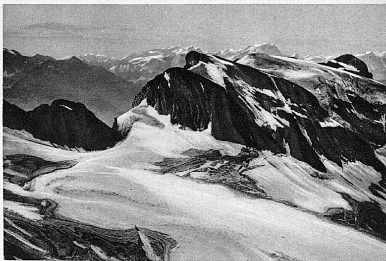
La chaîne des Ruchen-Glaernisch