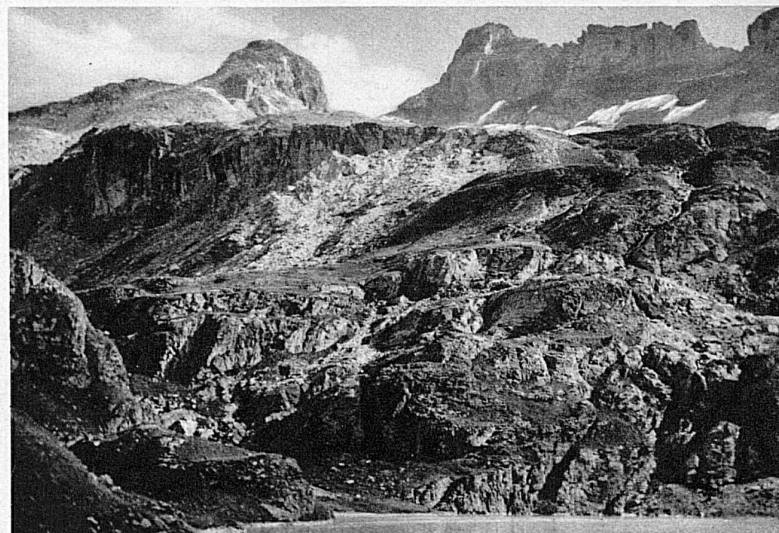
Le Kærpf dans les Alpes glaronnaises