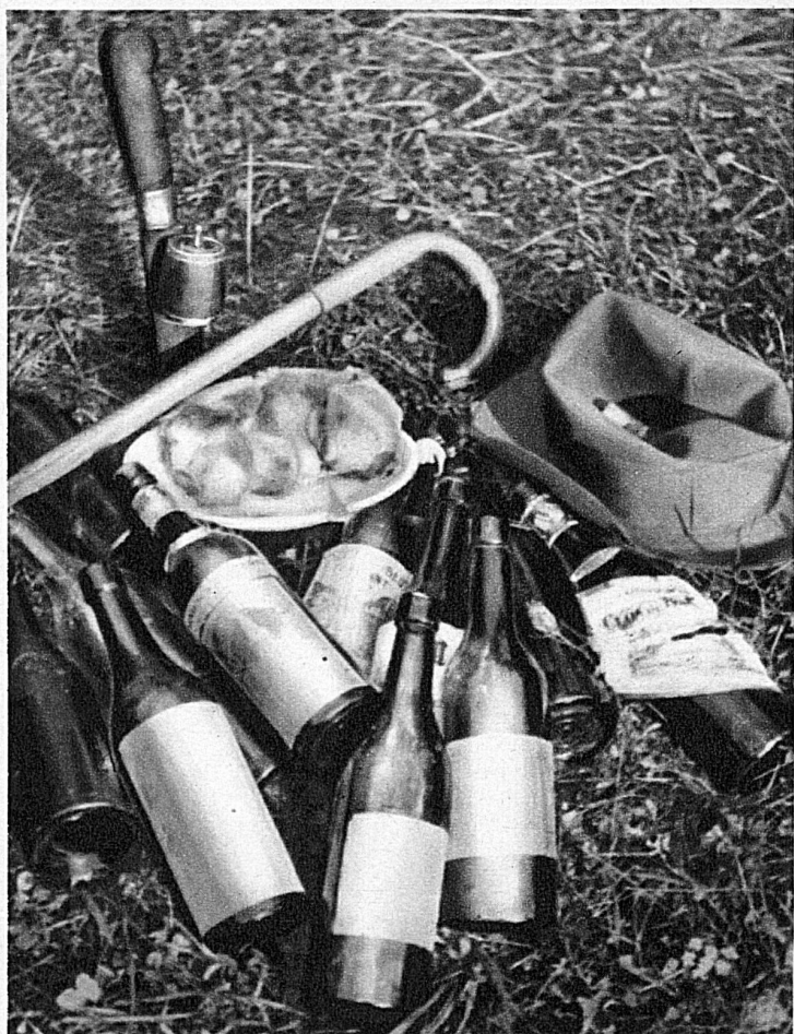
Zum Alpsegen gab der Herrgott dem Wallis auch einen feurig mundenden Wein, der beim Racletteessen gebührend zu Ehren kommt