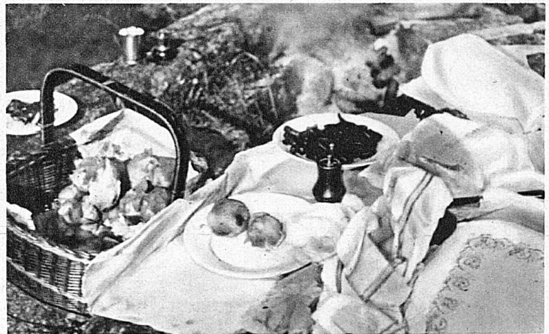
Kartoffeln, saure Gurken und Pfeffermühlen sind zur Raclette notwendiges Zubehör