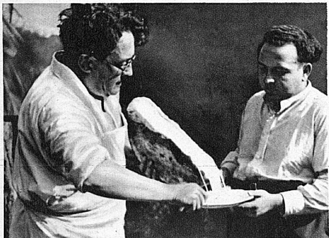
Mit elegantem Schwung wird die Raclette auf den Teller gestrichen