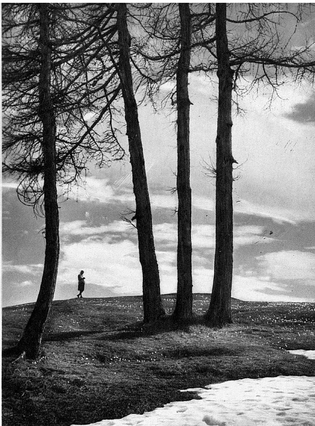
Der letzte Schnee