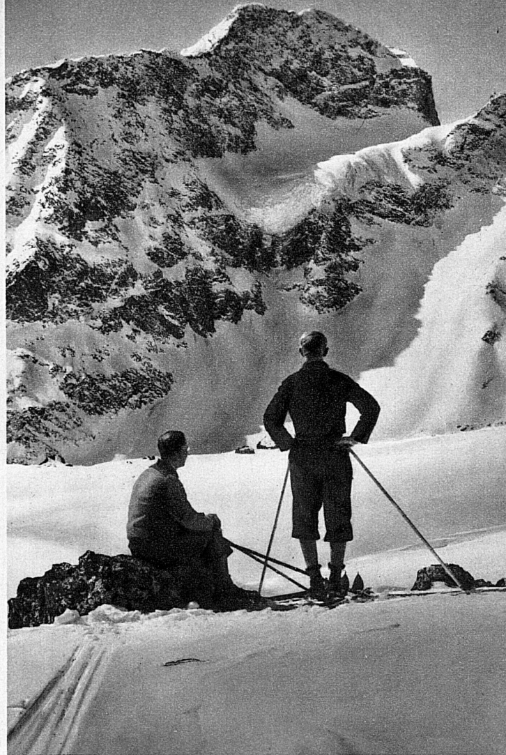
Vor dem Piz Julier bei St. Moritz

Chur, das nebenbei ein sehr glücklicher Mittelpunkt für \frac{3}{4} ganz Bündens ist und im Dreibündenstein einen Ski-Hausberg und Balkon der Bergschönheit hat, um den ihn alle Welt beneiden darf.