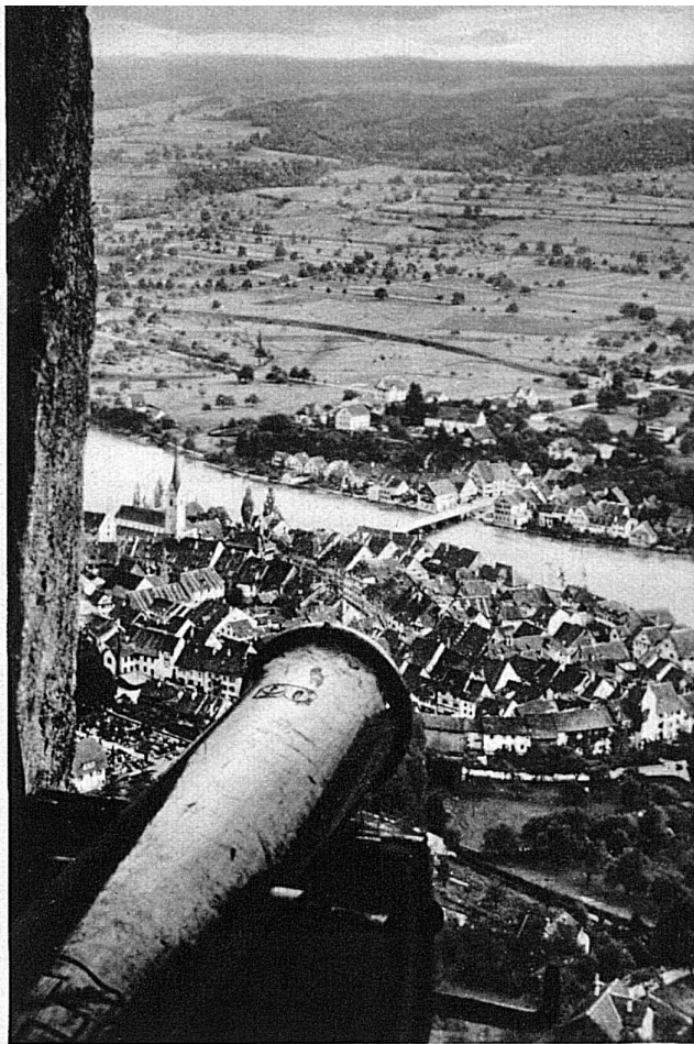
Le château de Hohenklingen, dominant Stein-am-Rhein (XII e siècle). Que doit penser ce vieux canon de toute cette paix, de ce bourg cosu, de cette verte opulence?

et qui, par l'affirmation de leur triple tour, semblent avoir voulu conquérir, après la terre, le ciel, et se créer des fiefs jusque dans les nuages. Les murs illustres de Chillon plongent dans la gloire azurée du Léman, qui les ceint comme d'un halo. Cette tour du Pfalz, dans la campagne saint-galloise, n'a-t-elle pas la bonhomie d'une grosse maison bourgeoise, toute baignée d'une quiétude qu'agrémentent encore, au printemps, la blanche illumination des arbres en fleurs? Du château de Hohenklingen, qui ne subit plus, sur sa