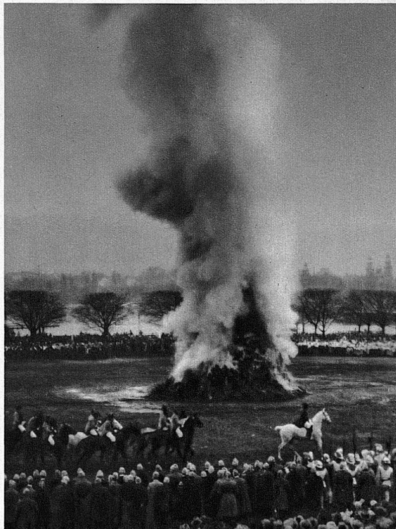
Unter dem Jubel der Volksmenge umkreisen die einzelnen Zünfte mit flatternden Bannern den brennenden Bögg.