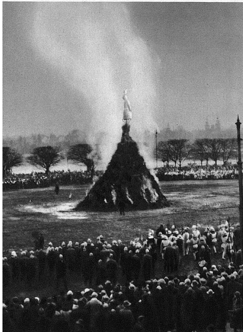
Auf dem Bellevueplatz wird der „Bögg“, das Symbol des scheidenden Winters, vor den Augen der vielen Zuschauer dem Feuertod übergeben.