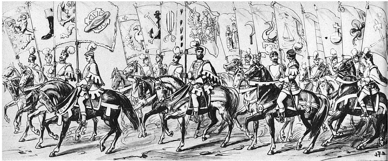
Der historische Sechseläuten-Umzug aus dem Jahre 1914.

Sechseläuten! Welch ein Wort für den Zürcher! Bald wird das alte Frühlingsfest Tausenden in der Stadt an der Limmat wieder frohe Stunden bringen. Lapidar und nüchtern mag der Protokollvermerk aus der Sitzung des engern Stadtrates lauten: «Das diesjährige Sechseläuten wird auf den 18. April festgesetzt», doch dem Zürcher sagen diese Worte unendlich mehr, er weiss ja ohnehin, dass Sechseläuten heute fast ausnahmslos auf den dritten Montag im Monat April fällt, und die Erinnerung an das bevorstehende Fest weckt