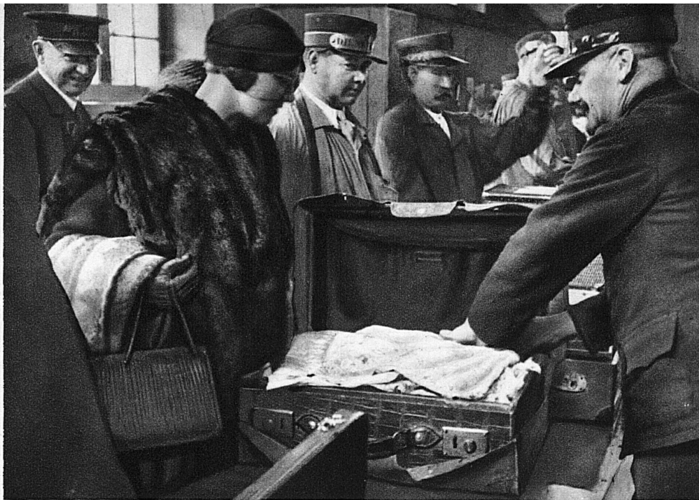
Auch vor dem duftenden Kofferinhalt des zarten Geschlechtes scheuen die Zöllner nicht zurück

Es gibt auch ganz Schlaue – die Schlaueit ist eine sehr verbreitete Tugend – die sich aus der Sache ziehen wollen, indem sie dem Beamten auf seine Frage nach zollpflichtigen Waren antworten, während sie ein Stück Handgepäck öffnen: «Da, sehen Sie selbst nach!» Sie hoffen dabei, der Beamte übersehe dieses oder jenes und erwische er etwas, so seien sie «fein 'raus», weil sie keine unrichtige Angabe gemacht hätten. Eine solche Einladung wird aber vom Beamten zum Bedauern des Schlaumeiers abgelehnt; denn jeder Reisende weiss, was sich in seinem Gepäck befindet, und er hat deshalb die an ihn gerichtete Frage mit einem klaren «Ja» oder «Nein» zu beantworten. Sagt der Schlaumeier dann «Nein» und es wird doch etwas Verzollbares entdeckt, so versucht er es mit der jedem Zollbeamten vertrauten Ausrede: «Ach, das haben mir meine Verwandten eingepackt, ohne dass ich etwas davon wusste!» Diese Ausrede ist so verbraucht, dass sie auch dem naivsten