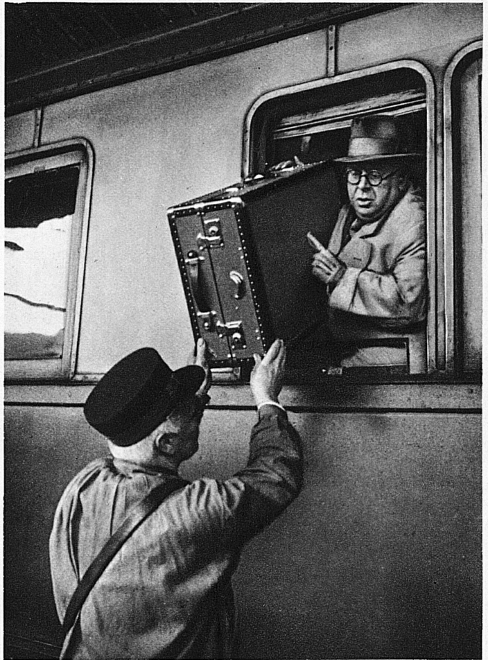
Szöke Szakall's Ankunft in Basel