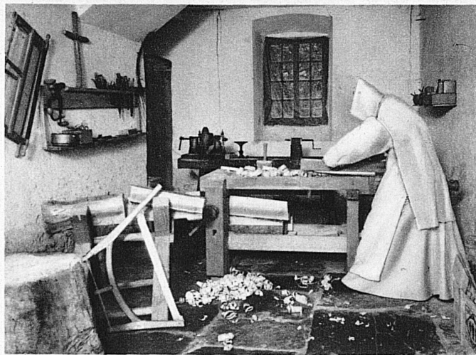
Un reclus travaille dans son atelier

La solitude, le silence, le jeûne, le cilice, la rupture du sommeil sont les formes imposées de l'ascèse cartusienne. Le