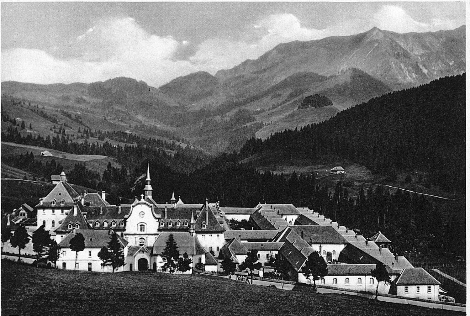
L'imposant édifice photographié des hauteurs environnantes

ville. On vous offre à manger des truites «vivantes», ce qui doit faire un drôle d'effet. On réveille au passage des champs de narcisses et de boutons d'or. Un parfum de chocolat traîne dans les branches de sapin. Peut-être n'est-ce qu'une interprétation olfactive de l'idée que, tout près, se trouve la fabrique Cailler. Il est en tout cas incontestable que les rochers d'en face sont en nougat, tandis que Brenleyre et Foliéran sont blancs et pointus comme des pains de sucre. Refoulons ces impressions alimentaires et, au lieu de tourner à droite pour aller vers Charmey et Bellegarde goûter les plaisirs de la villégiature, prenons à gauche le chemin tortueux qui mène à la thébaïde gruyérienne. Dans ce cirque de montagnes