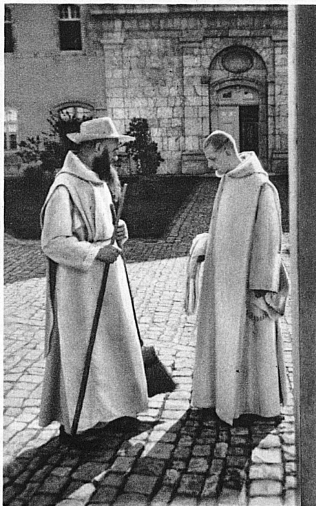
Au-dessus: Un père et un frère dans la cour principale du monastère

Ce n'est pas sans nostalgie que le visiteur quitte la Valsainte pour retrouver en bas le monde et ses misères, car il vient de prendre contact avec une forme de vie supérieure et des hommes plus grands que nature.