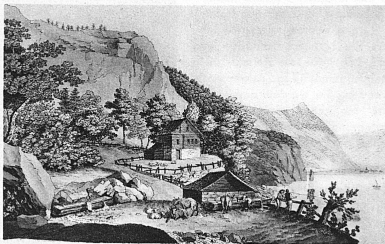
Une des vues les plus anciennes et des plus rares qui existent du Grütli. Publiée à Bâle, par Chrétien de Mechel, à la fin du 18 e siècle. Gravure en couleurs.