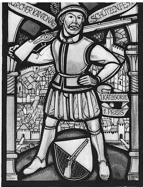
Sektionswappenscheibe aus der Glasmalerei Fritz Haufler in Basel, nach dem Entwurf von Paul Boesch in Bern

ditionellen Stichscheiben die Doppelbeträge wesentlich herabgesetzt worden sind und, was für die grosse Zahl der «Mittelschützen» von ausschlaggebender Bedeutung sein dürfte: Die ersten Spitzengaben werden zugunsten guter Mittelpreise abgebaut.