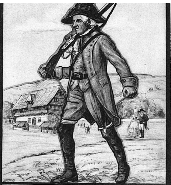
Bürcher Kantonal Schützenfest 1933 Albisgütli

Die Schützengesellschaft der Stadt Zürich als festgebende Sektion rüstet sich im heimeligen Albisgütli an den sanften Hängen des lieblichen Utlibergeres zum Kantonal Schützenfest. Weder Pessimismus noch Kopfhängertum lähmten die Arbeiten für einen Schiessplan, dessen Vorzüge sicher die Schützenkameraden aus dem ganzen Schweizerland in grossen Scharen nach dem schmucken Zürich locken wird. Nur kurz sei an dieser Stelle darauf hingewiesen, dass in den tra-