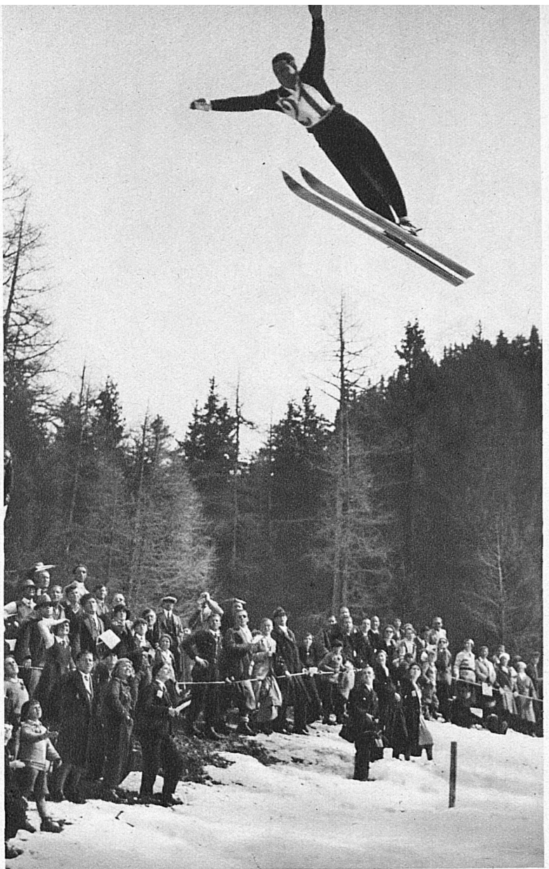
Der Flug des Menschen, diese höchste sportliche Leistung im Skilauf, zeigt Bilder von hoher Schönheit