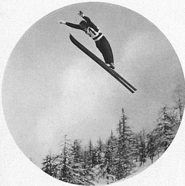
Sigmund Ruud, der bekannte Norweger-Springer, in seiner mächtigen Vorlage