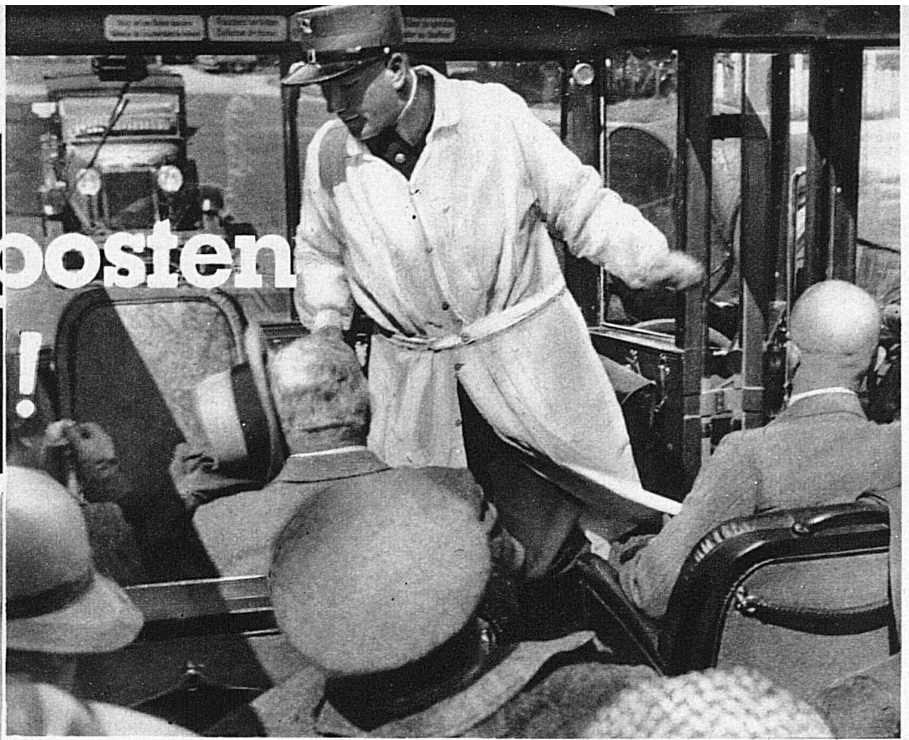
Im Postauto Meiringen—Gletsch Unten: Auf der Furkastrasse beim Rhonegletscher