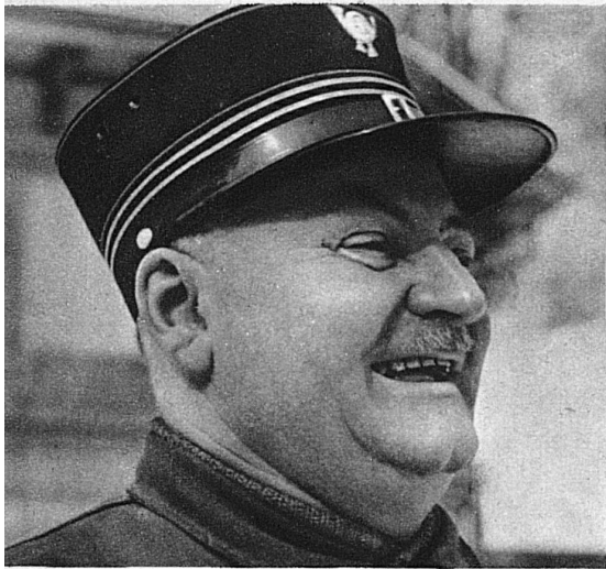
Ich kenne Grimsel, Furka und Gotthard wie meine Hosentasche