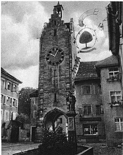
La porte de la ville à Diessenhofen