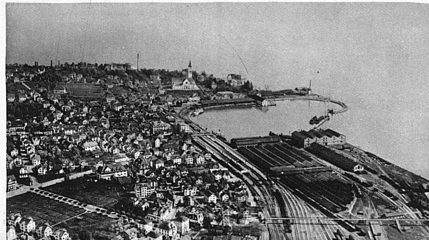
A droite : La ville de Romanshorn et son port