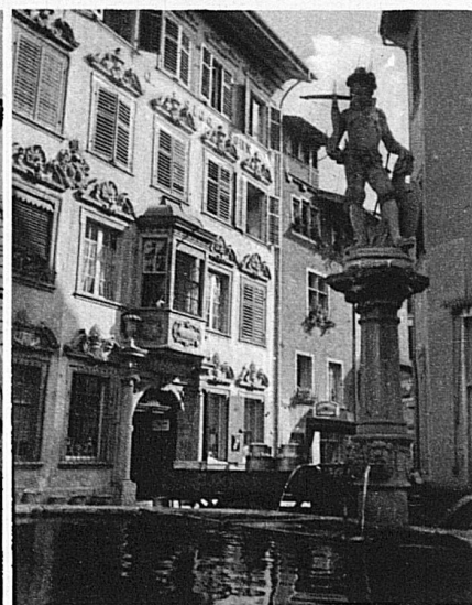
Schaffhouse, la ville des belles façades