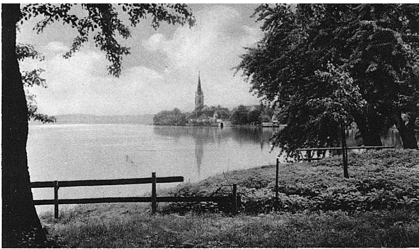
L'idyllique Berlingen sur le lac intérieur