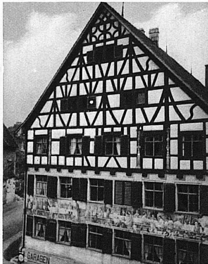
Façade caractéristique de la maison thurgovienne