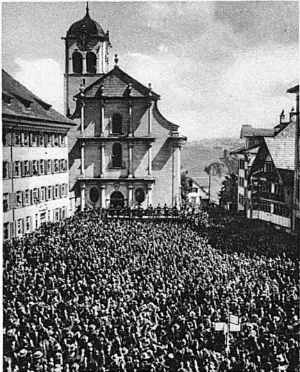
La Landsgemeinde à Trogen