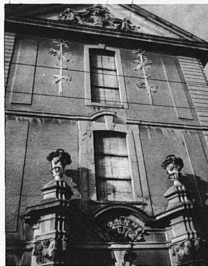
La grenette de Rorschach