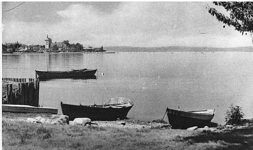
Vue d'Arbon à travers la nappe d'eau

Généralement, c'est par Schaffhouse que l'on passe pour atteindre le lac. Tout près de là, à Neuhausen, le Rhin, avant de devenir le bel adolescent qu'il est à Bâle puis le fleuve légendaire d'Allemagne, a encore une dernière joie d'enfant, et fait dans le vide un saut prodigieux. Il y a vingt-cinq ans, la page la plus lue et la plus usée du Bædeker pour la Suisse était celle qui relatait la splendeur de la chute du Rhin. A l'heure actuelle encore, bien que les goûts aient changé, il vaut la peine d'aller en barque, sous la chute, prendre une douche pour le moins originale. Remontons ensuite le fleuve le long des rives enchanteresses, faisons halte à Stein am Rhein, pure merveille héritée intacte du moyen âge, avec ses clochers, ses tours, ses couvents se reflétant dans l'eau. Prenons ensuite un bateau et, si nous sommes bien sages, il nous sera peut-être donné de voir, de l'autre côté du lac, le vaisseau d'argent du Zeppelin s'élever tout à coup, puis battre les flots bleus du ciel pour aller saluer la