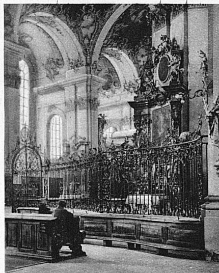
Détail de la célèbre cathédrale de St-Gall