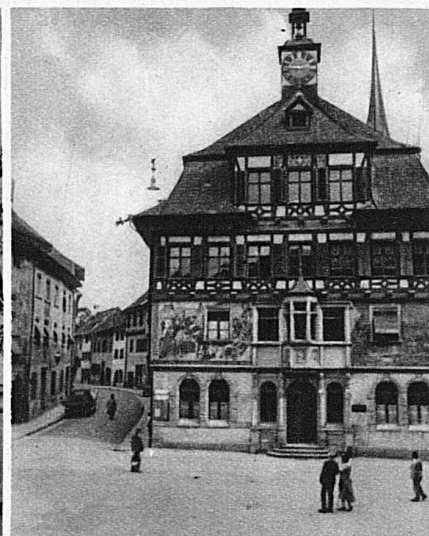
L'hôtel de ville de Stein am Rhein