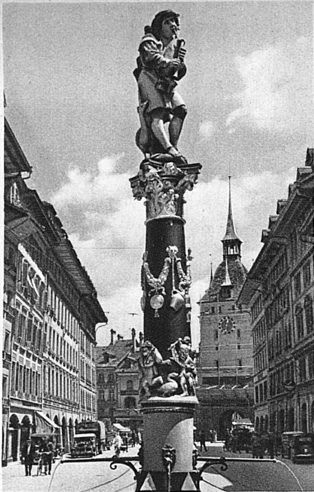
Der Dudelsackpfeiferbrunnen an der Spitalgasse

Stadt und zur Aufnahme von Landflüchtigen sehr weit gefasst worden sein. Diese starke Befestigung, welche mit doppelter Mauer und doppeltem Graben die aarumflossene Halbinsel natürlich abschloss, war durch viele Türme bewehrt; wie der Zeitglockenturm die Zähringerstadt abschloss und der Käfigturm die savoyische Stadt begrenzte, so bildete einst der mächtige Christoffelturm den Marchstein der letzten Stadterweiterung.