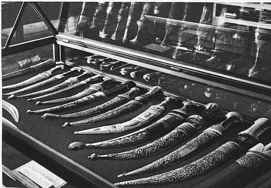
Aus der Mosersammlung des historischen Museums in Bern

Die schweizerischen Museen vermitteln nicht nur einen umfassenden Begriff von der Geschichte und der vielgestaltigen Kultur unseres viersprachigen Landes, von schweizerischer Kunst und Arbeit, von den Pflanzen, Tieren und Gesteinsarten der Heimat, sie enthalten ausserordentlich wertvolle und schöne Kunst- und Naturaliensammlungen von Gegenständen aus aller Welt. Besonders sehenswert ist die grosse Mosersche Orientammlung im bernischen historischen Museum.