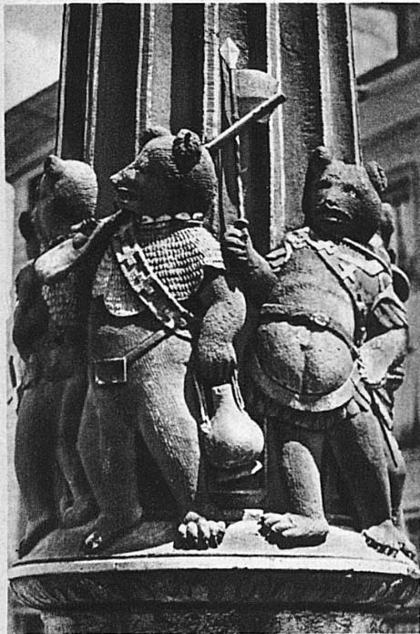
Der drollige Reigen der Berner Wappentiere am Kindlifresserbrunnen

Schon um 1255 erwies sich das alte Stadtgebiet als zu klein, den offenbar überaus starken Zustrom von Schirm- und Schutzsuchenden innerhalb seiner Mauern zu fassen. Unter dem Beirat des mit Bern verbündeten Herzogs von Savoyen, unter dessen mächtigen Schutz sich die Berner wegen kriegerischen Bedrohungen durch die Habsburger begeben hatten, wurde die Stadt bis zum Käfigturm erweitert, um die Schutzsuchenden der Landschaft und die savoyische Hilfsmannschaft aufnehmen zu können. Es werden sich vor den Toren der Stadt Siedlungen gebildet haben, die es galt, in den Kreis der Ringmauern einzubeziehen; wohl auch um die nächsten Gärten und Aecker zur Versorgung der Stadt nutzbar zu machen — denn eine so rasche Vermehrung der Wohnbevölkerung während der 64 Jahre seit der Erbauung ist kaum wahrscheinlich — wurden die Stadtmauern bis zum zweiten grossen Graben (der sich vom Bundeshaus-Mittelbau bis zum Knabenwaisenhaus erstreckte) vorgeschoben. Es ist dies die alte oder niedere Neustadt. Die letzte Erweiterung der Stadt, die dann für ein halbes Jahrtausend ihren Lebensraum bestimmte, wurde um das Jahr 1345 in den bedrohten Zeiten des Laupenkrieges vorgenommen. Wie die Ausdehnung von 1255 mag auch sie wegen der Kriegswirren zur Versorgung der