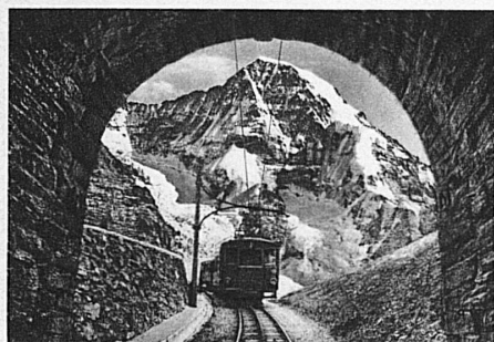
Jungfrauobahn. Der Mönch (4105 m)