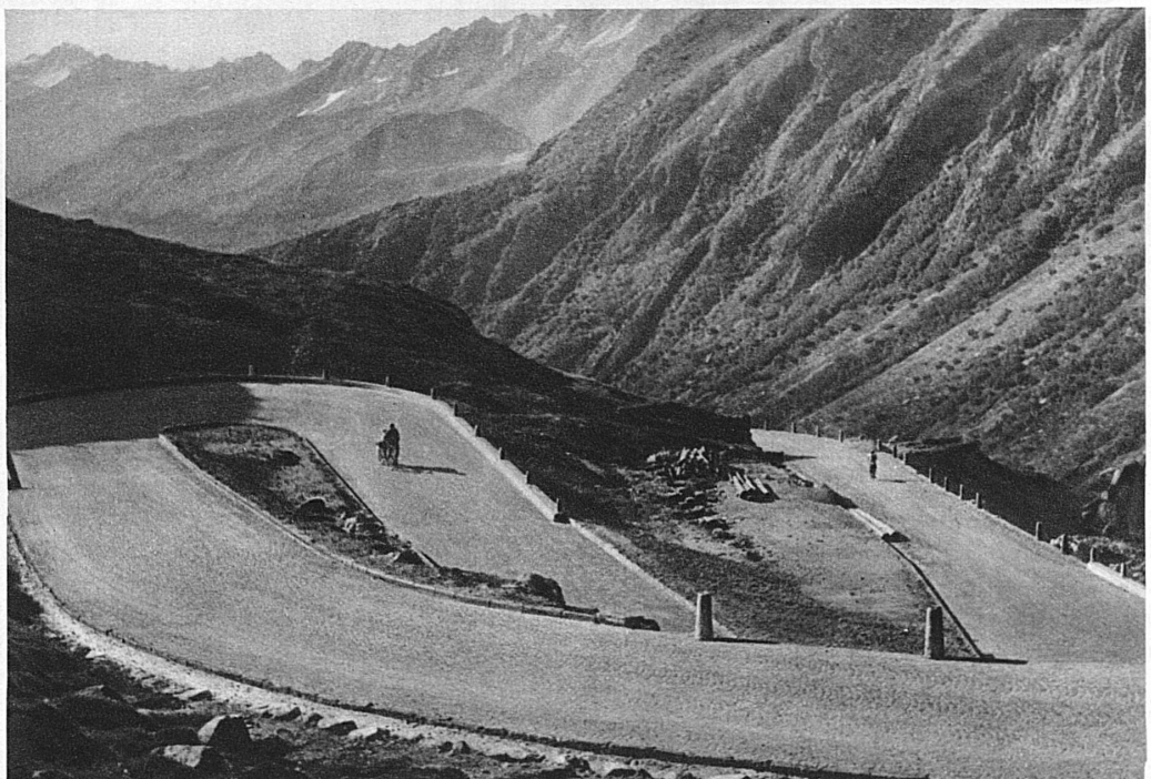
An prächtigen Wasserfällen vorbei durch die Tremola ins Tal des Tessin