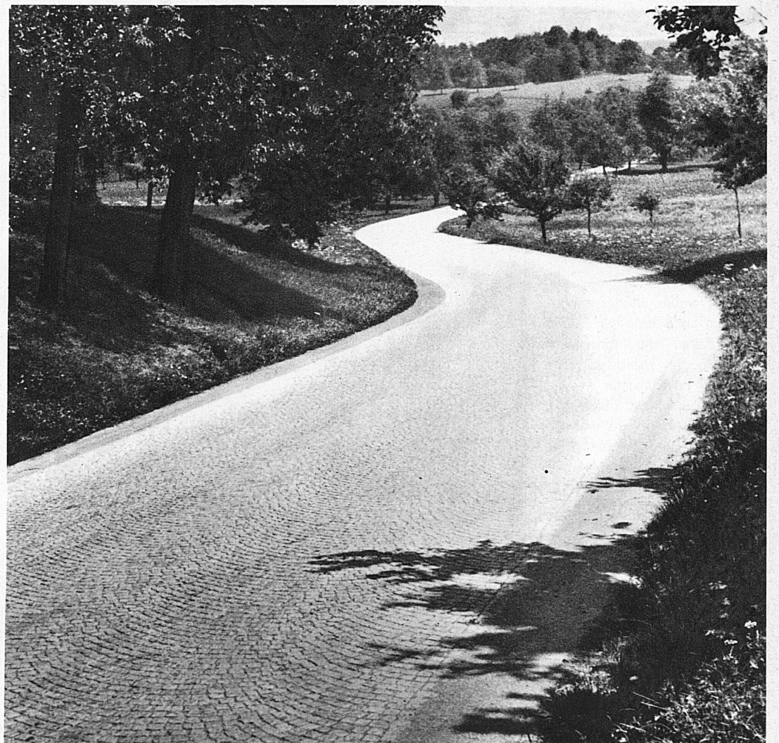
In herrlicher Fahrt auf der grossen, gepflästerten Ueberlandstrasse. Zwischen Lenzburg und Aarau

Besonders dann ist es herrlich, auf ihnen zu fahren, wenn die Tage schön sind und königliche Blumenkohlwolken am tiefblauen Himmel ziehen, wenn die sattgrüne Sommerwelt allüberall von Vogel-singen tönt. Dann springt unbändiges Reisefieber jäh in uns auf, diese Strassen kreuz und quer kennen zu lernen. Und die Landschaft tut der Strasse entlang überall ihre Wunder auf, und unsere Arbeit läuft auf Leerlauf.