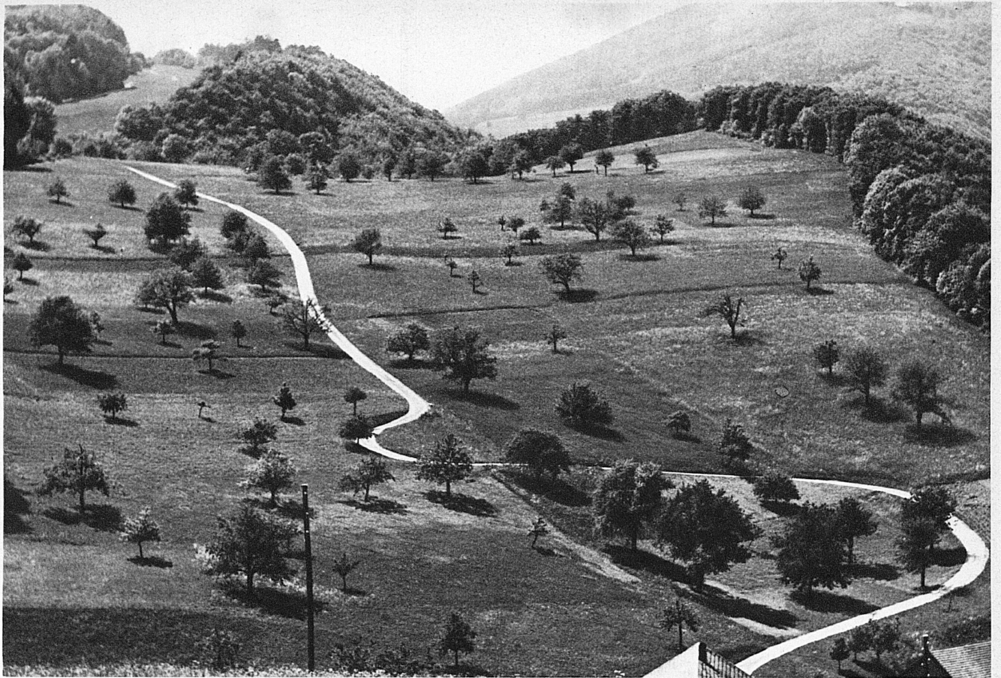
Wundervoll fügt sich das Band in die Landschaft. Strasse am Hauenstein