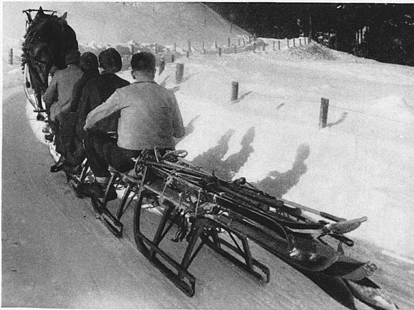
Mit dem Hafermotor in gemütlichem Schritt zum hochgelegenen Start