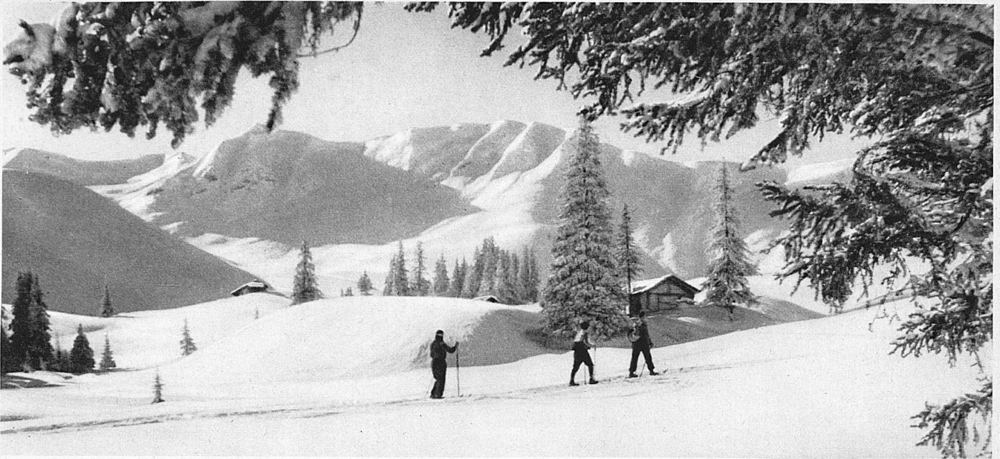
Das Skiparadies auf dem Hahnenmoos bei Adelboden