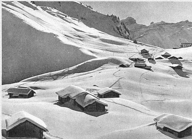
Das Skigebiet von Villars-Chesières-Arveyes in den Waadtländer Alpen