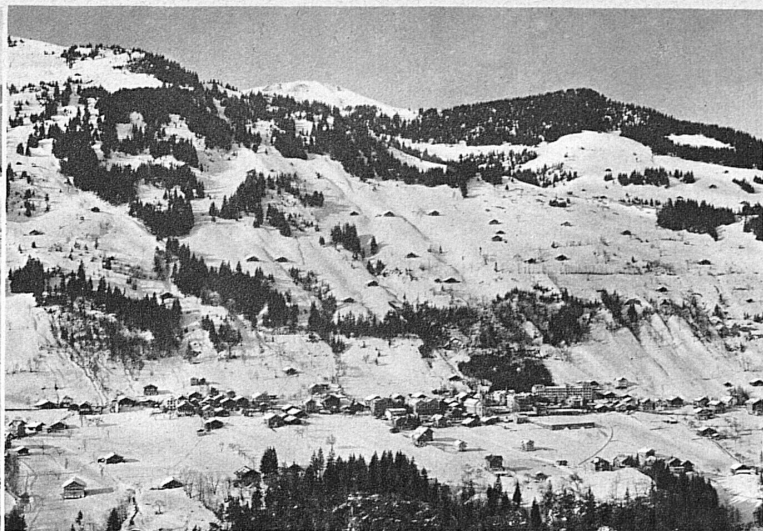
Champéry, der schöne Walliser Wintersportplatz im Val d'Illeiez

Eishockey das rassistigste und spannendste Eisspiel. Sechs Mann gegen sechs umkämpfen mit dem leichtgebogenen Stock den Puck, die runde, flache und gehärtete Kautschukscheibe und versuchen, ihn ins Goal zu spielen. Ein harter Strauss! Atemberaubendes Tempo kann das Spiel erreichen. Die Schlittschuhe flitzen, kratzen, knirschen, Mann prallt an Mann, der Puck, der kleine Dämon auf dem Plan, kommt nicht zur Ruhe. Der Goalkeeper, gepanzert wie ein Tiefseetaucher, steht bereit im Goal, verfolgt das Spiel, gewärtigt jeden Augenblick den jähren Schuss, wehrt ab, wirft sich zu Boden.