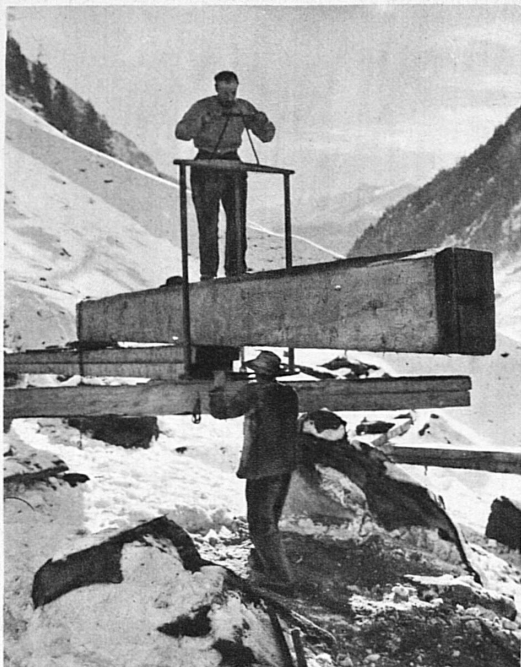
Les scieurs de long (Loetschental)