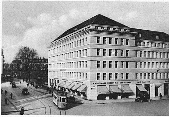
Grand Café Sihlporte, Zürich