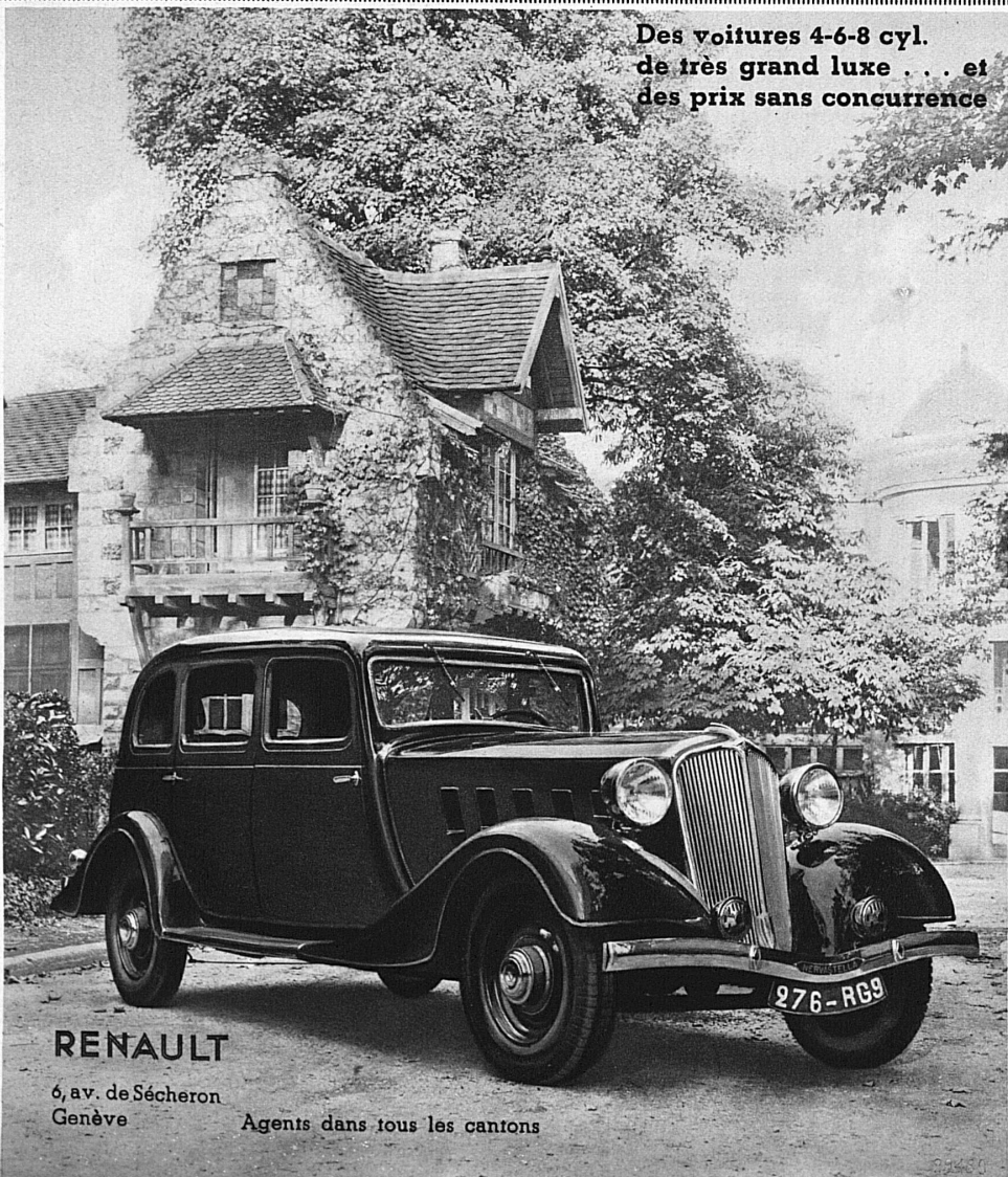
Des voitures 4-6-8 cyl. de très grand luxe . . . et des prix sans concurrence

La facilité consistera dans le droit pour chaque voyageur qui paie la taxe entière de prendre avec soi sans autres débours deux enfants âgés de moins de 12 ans, ou bien une jeune fille ou un jeune homme âgés de moins de 16 ans. Elle est accordée aux personnes munies de billets de simple course, de billets d'aller et retour, de billets circulaires à itinéraire fixe et de billets combinables. Il sera délivré, sur demande expresse faite au guichet, des billets spéciaux pour les jeunes gens voyageant gratuitement. Ces billets gratuits ont, au cours de la quinzaine de voyage, la même durée de validité que les titres de transport du compagnon de voyage, ils sont valables également pour le même trajet et dans la même classe.