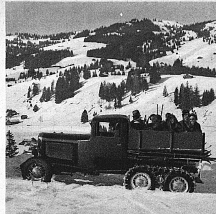
Fahrt mit dem Raupenauto in das herrliche Skigelände von Saanenmöser

Von den nicht prämierten Arbeiten kann die Jury nach freiem Ermessen die ihr konvenierenden innerhalb des verfügbaren Kredites zu üblichen Honoraransätzen erwerben. Die gleiche Möglichkeit hat die Schweizerische Verkehrszentrale nach Durchführung des Wettbewerbes.