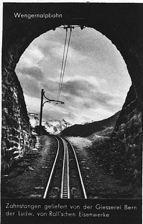
Zahnstangen geliefert von der Giesserei Bern der Ludw. von Roll'schen Eisenwerke

Walzwerke • Schmiede • Giessereien • Elektrostahlwerk • Mech. Werkstätten