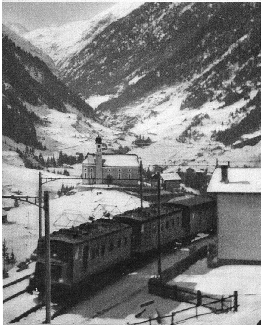
Andermatt entgegen! Das berühmte Kirchlein von Wassen — En route pour Andermatt! La célèbre petite église de Wassen

Das Grosse Landesrennen der Schweiz erhält von Jahr zu Jahr erhöhte Bedeutung. Beschickung und Auslese für Spitzenleistungen gewinnen immer mehr. Die verschiedenen Disziplinen werden in erweiterter Form — gemäss Beschlüssen der Bieler Delegiertenversammlung — neu durchgeführt, um auf versuchsweiser Grundlage die Meisterschaft neu zu kombinieren mit Abfahrt und Slalom. Das zeigt den wirklich fortschrittlichen Geist, der durch die schweizerische Skibewegung geht. Der Skimeister wird dieses Jahr somit probeweise in einer Viererkombination vergeben: