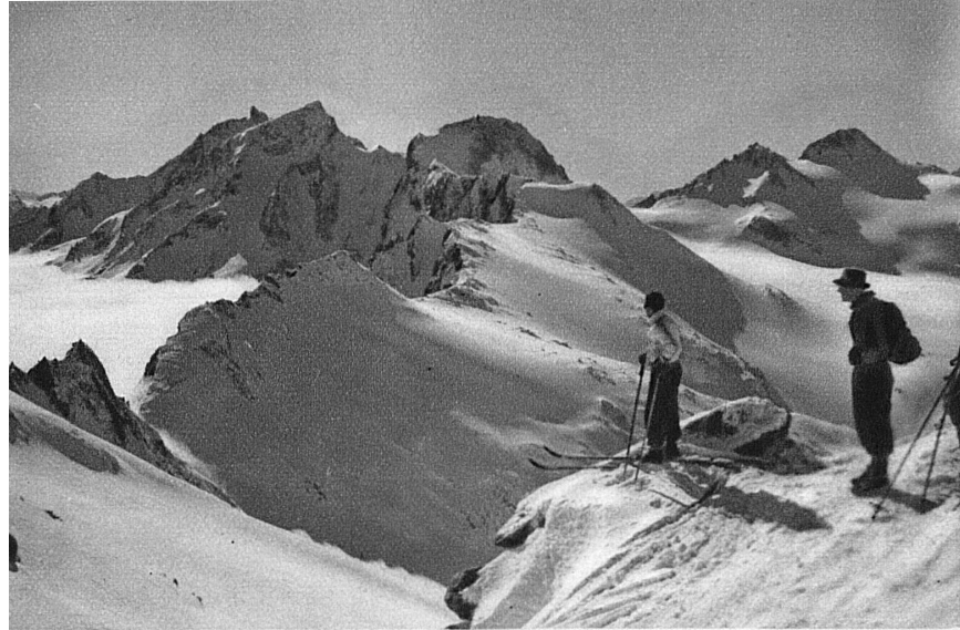
Im Rotondogebiet bei Andermatt — La région de Rotondo dans les environs d'Andermatt