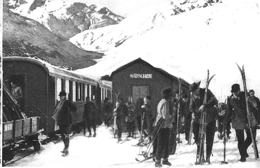
Nätschen! Alles aussteigen!! — Naetschen! Tout le monde descend!! Unten: Die Gotthardschanze von Andermatt — La route du St-Gothard près d'Andermatt