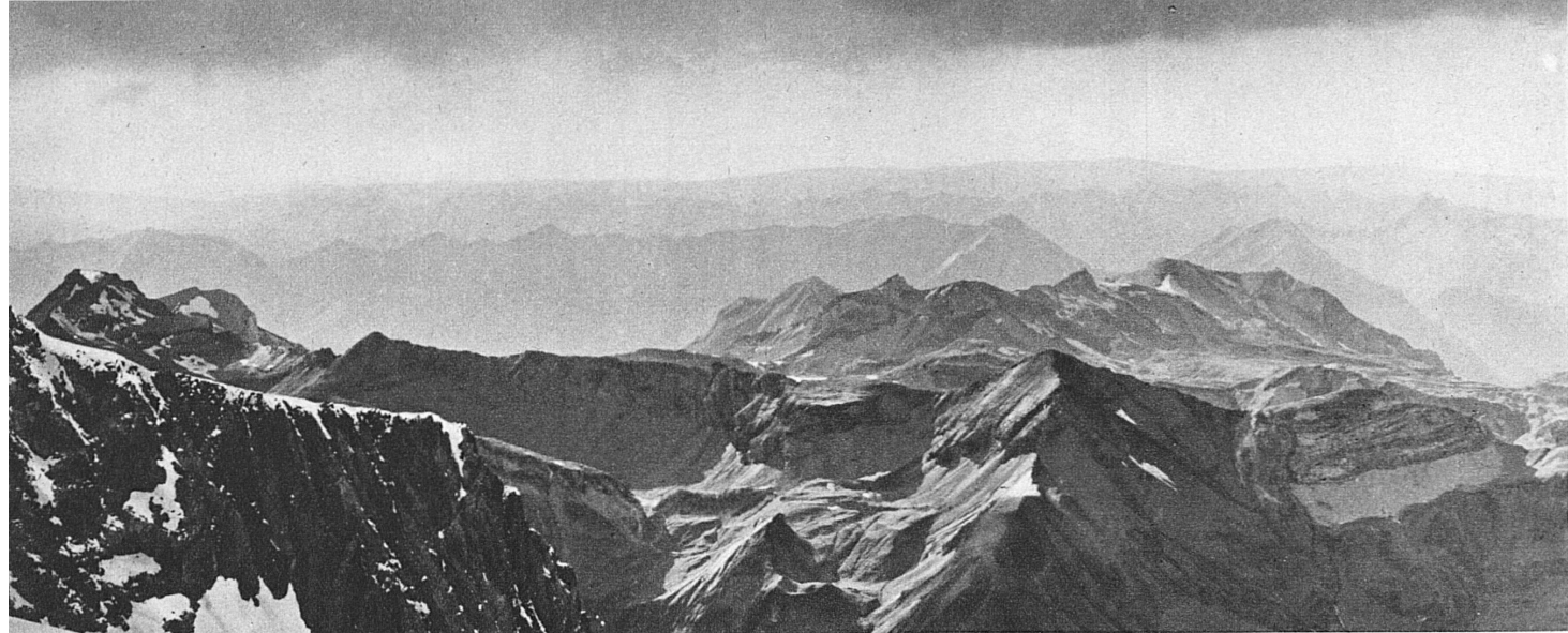
Blick vom Jungfraujoch nach Norden. Die Schweizer Skischule Jungfraujoch ist bis in den späten Sommer hinein in Betrieb; sie wird geleitet vom Schweizer Skimeister Fritz Steuri