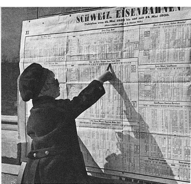
Der kleine Sachverständige