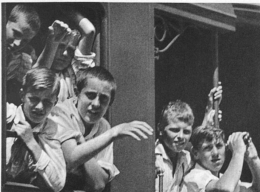
Vier Plätze gibt es an einem Fenster