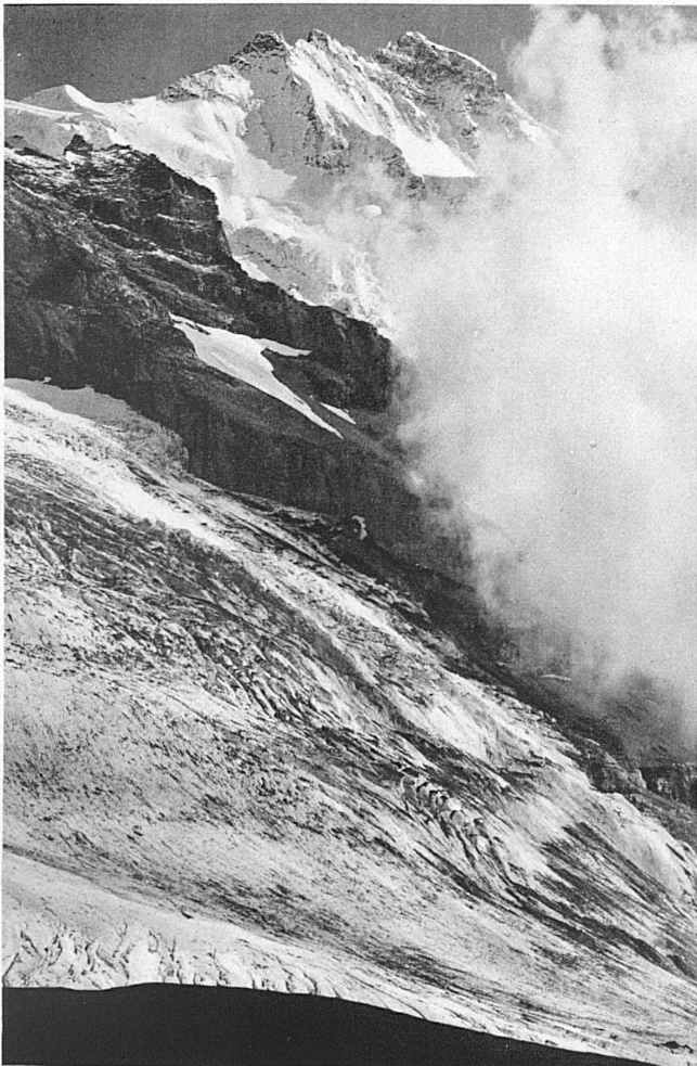
Vom Tal aufsteigende Nebel über Eigergletscher