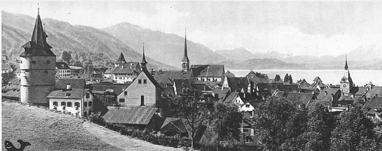
Das alte Städtchen Zug im Kirschenland