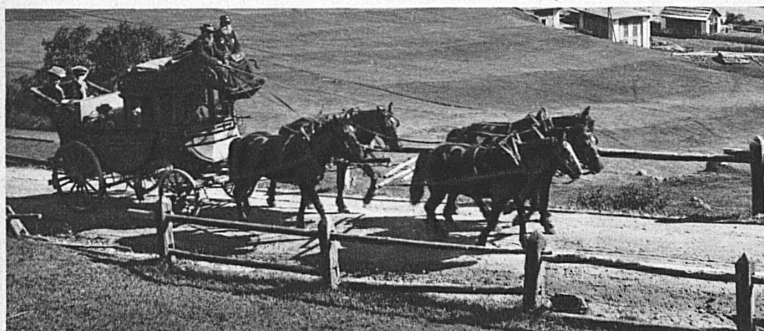
Hier geht die fünffache Pferdekraft noch leibhaftig, vom bärtigen alten Kutscher dirigiert, vor dem Fahrzeug her