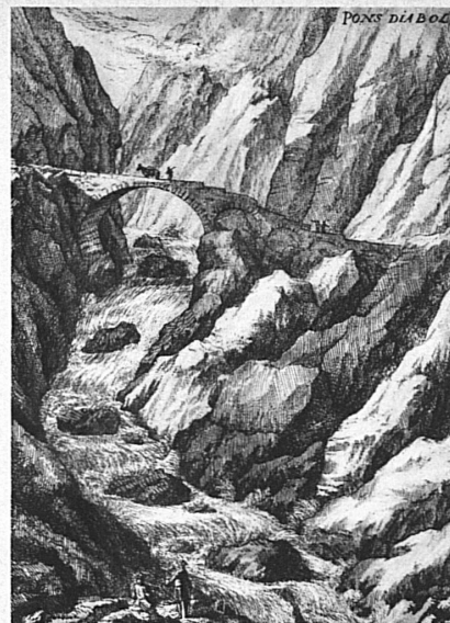
Pons Diaboli, Teufelsbrücke, heisst der alte Übergang über die tosende Reuss.

Wie diese Bewegung sich steigerte, wie sich die Sohle von dem harten Saumweg löste und der muntere Rädergang einsetzte, bis endlich auch das Fahrzeug den Boden verliess, wird uns in der historischen Abteilung der schweizerischen Verkehrsausstellung in Luzern gezeigt. Einst und Jetzt sind sich in reizvollem Kontrast gegenübergestellt.