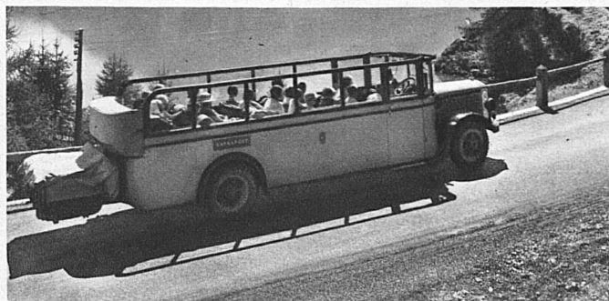
Der «gelbe Freund», der mächtige Wagen der schweizerischen Alpenpost, der heute die grossen Gebirgsstrassen befährt