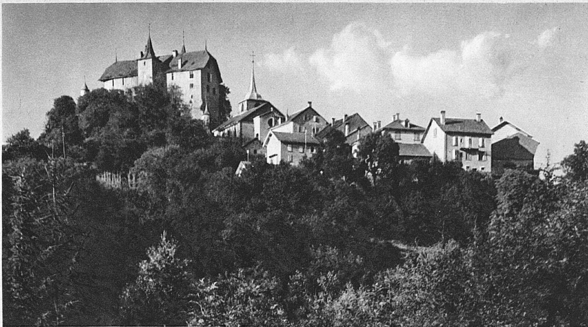
Rue, dans la Broye fribourgeoise, à l'écart de la grande circulation, règne paisiblement sur les bois et les champs