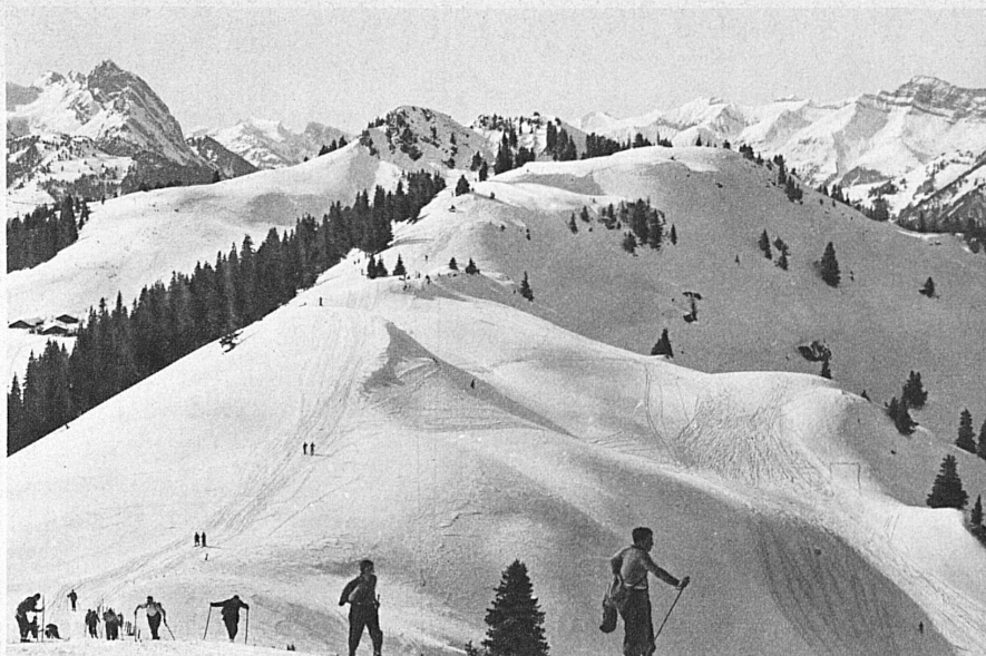
Route du Hornberg-Rinderberg sur Gstaad (Oberland bernois) - The Hornberg-Rinderberg Route near Gstaad (Bernese Oberland) - Die Hornberg-Rinderbergroute bei Gstaad (Berne Oberland)