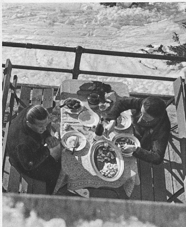
Sur la terrasse de Trübsee près Engelberg - A sunny Terrace at Trübsee, near Engelberg - Sonnige Terrasse auf Trübsee bei Engelberg