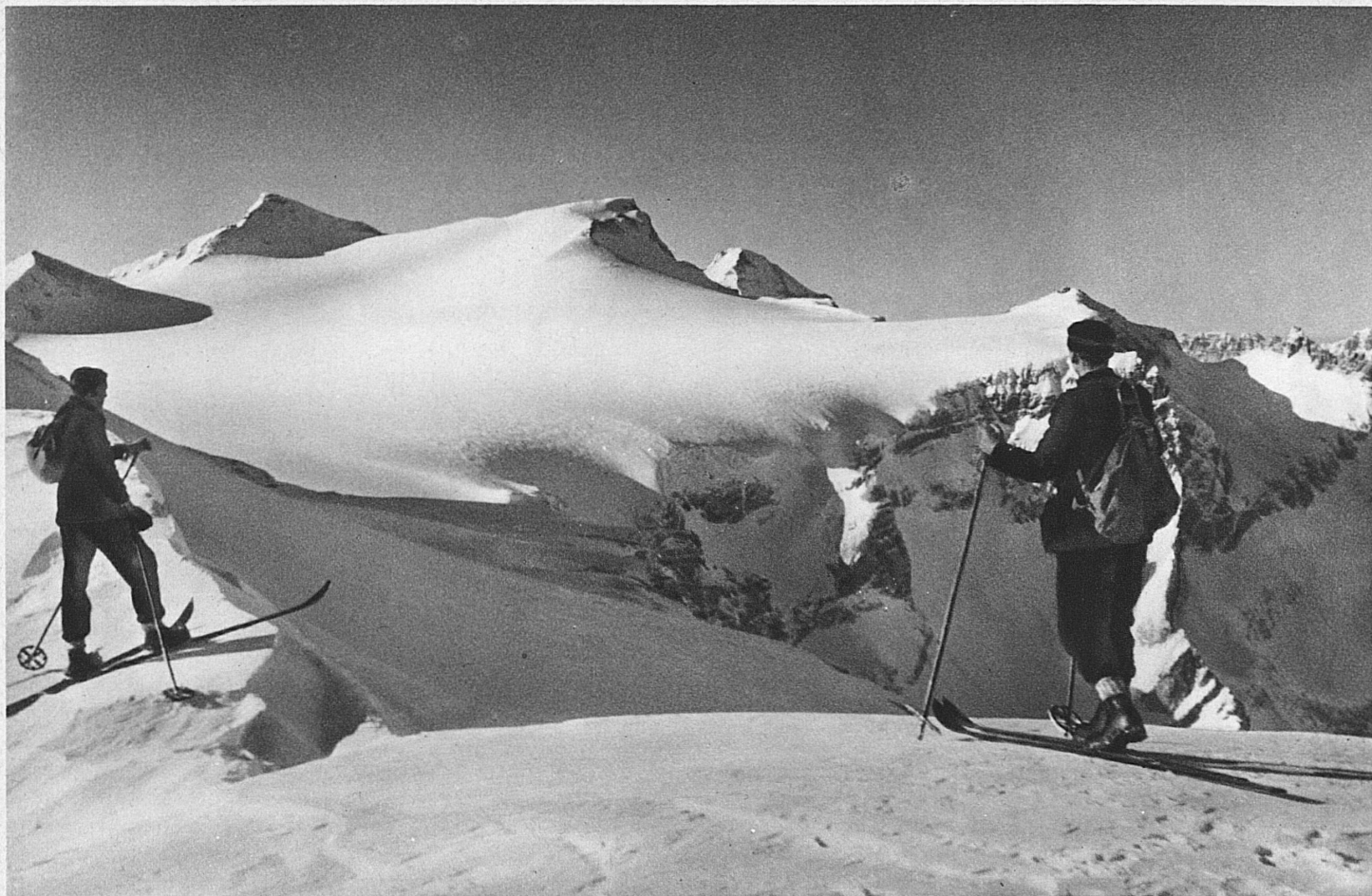
Sur les hauteurs de Flims: Le Vorab vu de Martinsmahd - Winter at Flims: the Vorab as seen from Martinsmahd - Im Flimser Gebirgswinter: Der Vorab von Martinsmahd aus