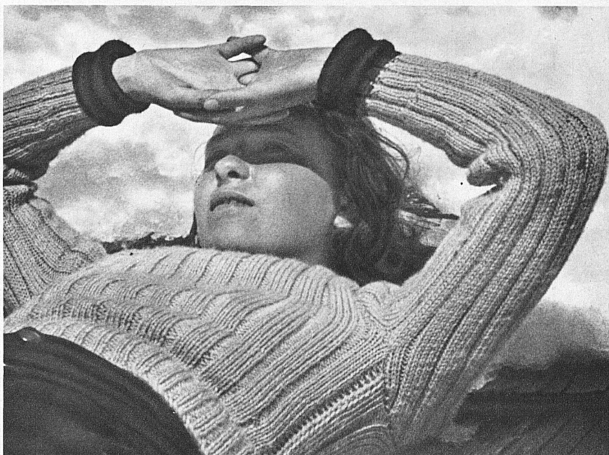
Au soleil d'Illtios - Alp Illtios (Toggenburg) in a Blaze of Sunshine - Sonnenglut auf Alp Illtios